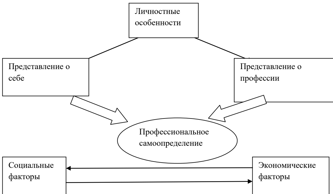
Рис. 1 Профессиональное самоопределение

Поставленные задачи могут иметь только комплексное решение. Вся деятельность по формированию профессионального самоопределения у обучающихся в общеобразовательных учреждениях, с одной стороны, должна иметь системный характер, но с другой – необязательно быть представленной единой программой. Это означает, что различные направления учебной и воспитательной работы могут быть сконцентрированы на решении задач профессионального самоопределения, что, в конечном итоге, позволит выпускникам адаптироваться в современном мире и быть успешными в обществе.