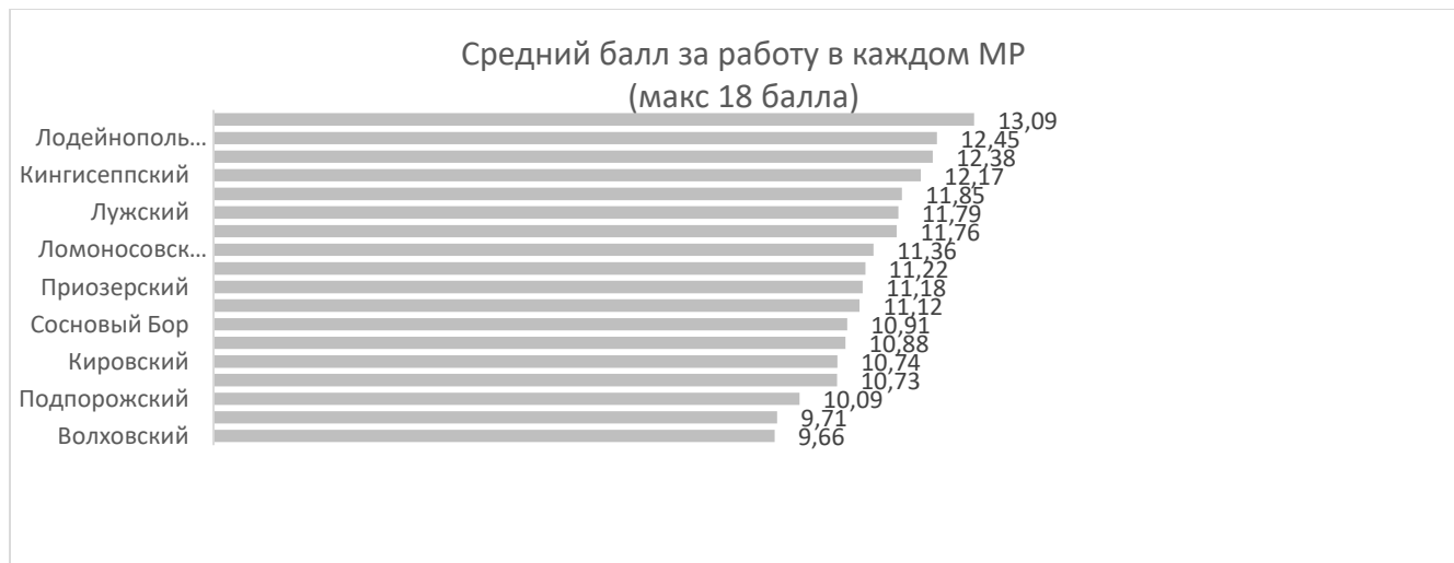
Рисунок 1. Средний балл за диагностическую работу по муниципальным районам

Ниже представлен средний балл по муниципальным образованиям Ленинградской области по результатам диагностической работы в целом.