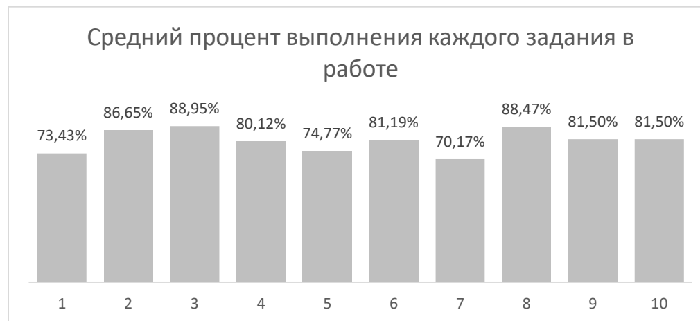
Рисунок 2. Средний процент выполнения каждого задания диагностической работы

Сравнительный анализ среднего процента выполнения учащимися 3 класса каждого задания представлен на рисунке 3: