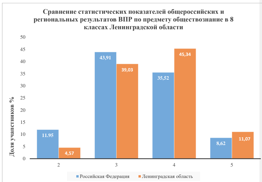
Рисунок 2. Гистограмма распределения долей участников ВПР по обществознанию в 8 классах по отметкам