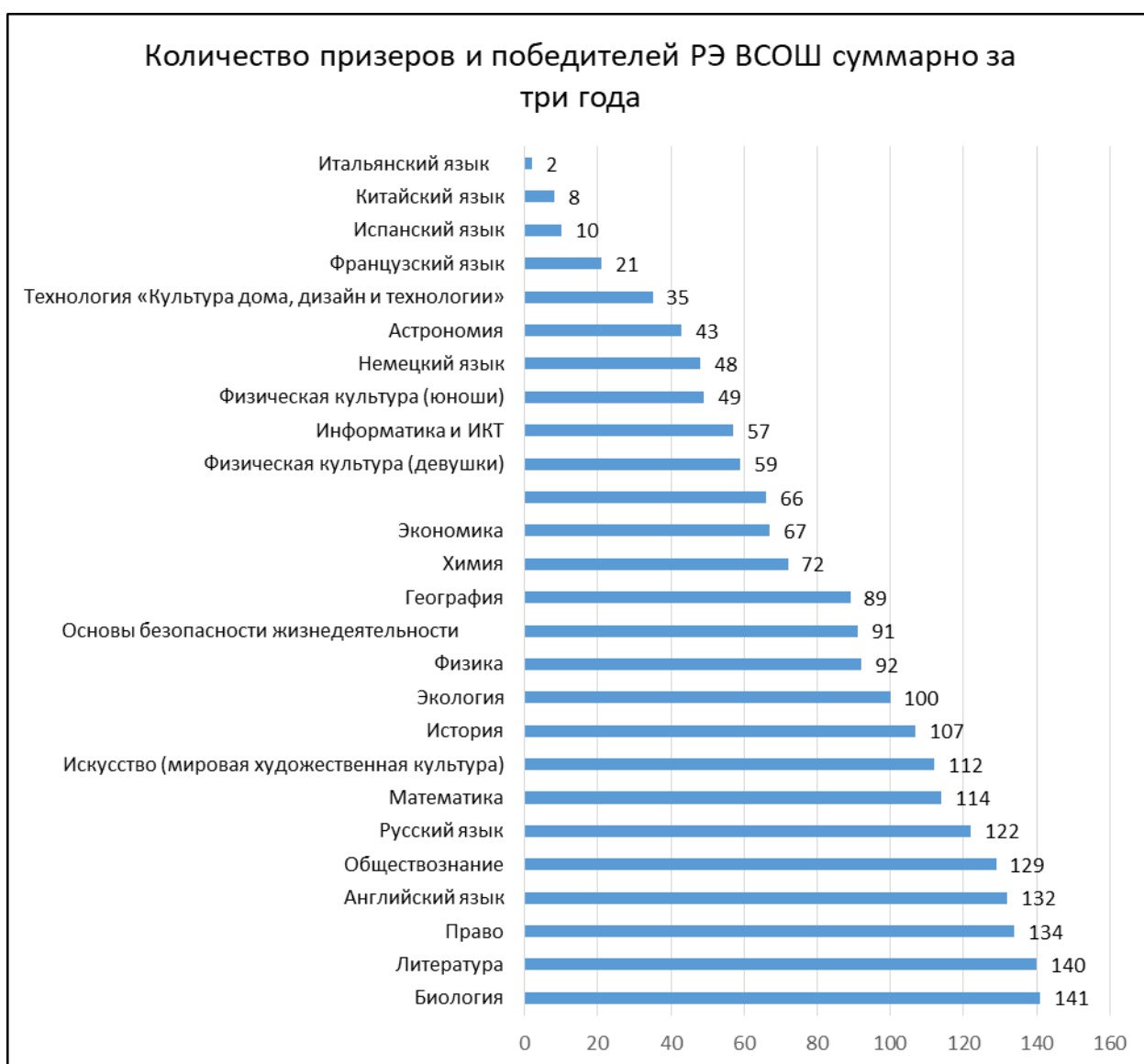
Диаграмма 2. Рейтинг предметов на региональном этапе олимпиады суммарно за 3 года по числу призеров и победителей

Заключительный этап олимпиады в основном подтверждает лидирующие позиции предметной подготовки обучающихся в разные годы. Так, из числа учебных предметов, где были отмечены победы наших обучающихся в 2021 году на заключительном этапе Всероссийской