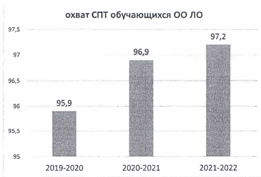
Рисунок 1. Динамика активности участия обучающихся Ленинградской области в СПТ (%)

и старше). Охват тестированием в 2021-2022 году составил 97,6% от общего количества обучающихся, подлежащих прохождению социально-психологического тестирования (в 2020-2021 -96,86%; 2019/2020 - 95,89%). Анализ полученных данных (рис.1) позволяют сделать вывод о положительной динамике активности участия обучающихся Ленинградской области в социально-психологическом тестировании.